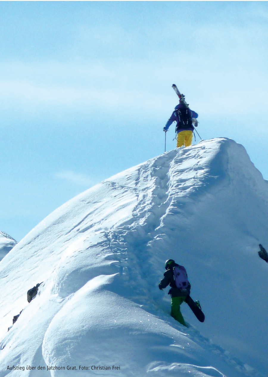
Aufstieg über den Jatzhorn Grat.