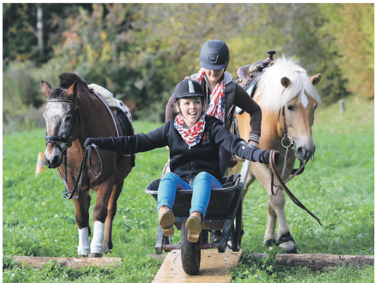
Die Darbietungen der Zweierteams waren sehr kreativ.